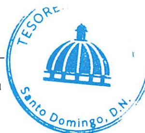
CELESTE BAUTISTA LARA Encargada Administrativa y Financiera

NOTA: Los participantes en dicho proceso deben presentar muestra de los artículos requeridos. Las muestras deben de ser entregadas antes del tiempo de apertura de ofertas, y participar por todos los ítems, lo cual está establecido en el portal transaccional.